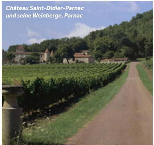
Château Saint-Didier-Parnac und seine Weinberge, Parnac

Einrichtungen vor Ort: Carrefour Lebensmittelgeschäft (2km von den Anlegeplätzen entfernt)