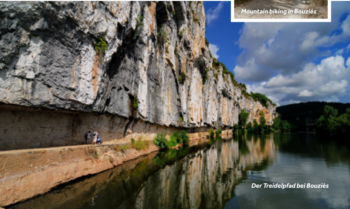
Der Treidelpfad bei Bouziès