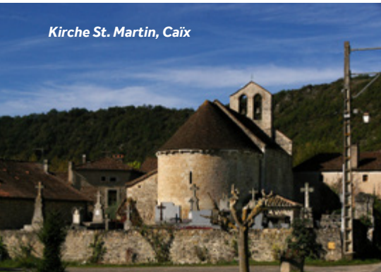
Kirche St. Martin, Caïx