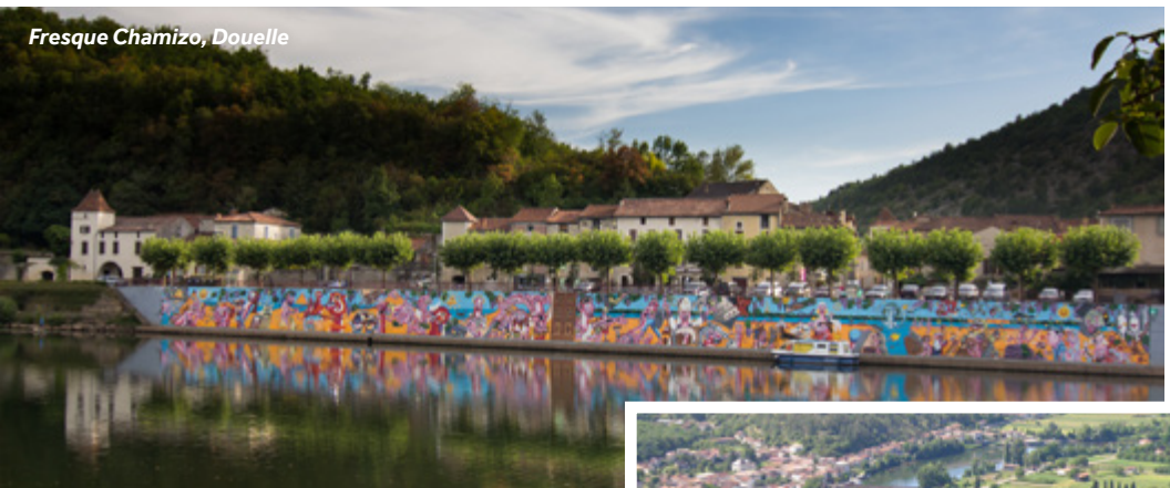
Fresque Chamizo, Douelle

Einrichtungen vor Ort: Lebensmittelgeschäft & Backwaren (600m von den Anlegeplätzen entfernt)