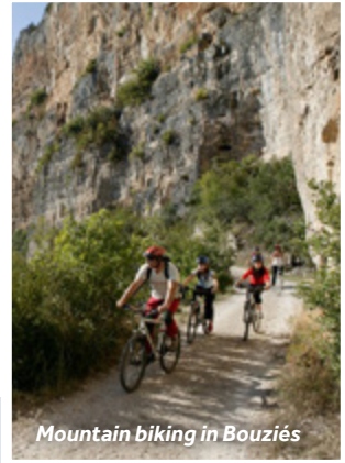
Mountain biking in Bouziès

Restaurantempfehlung: Les Falaises, einen kurzen Spaziergang von den Anlegern entfernt