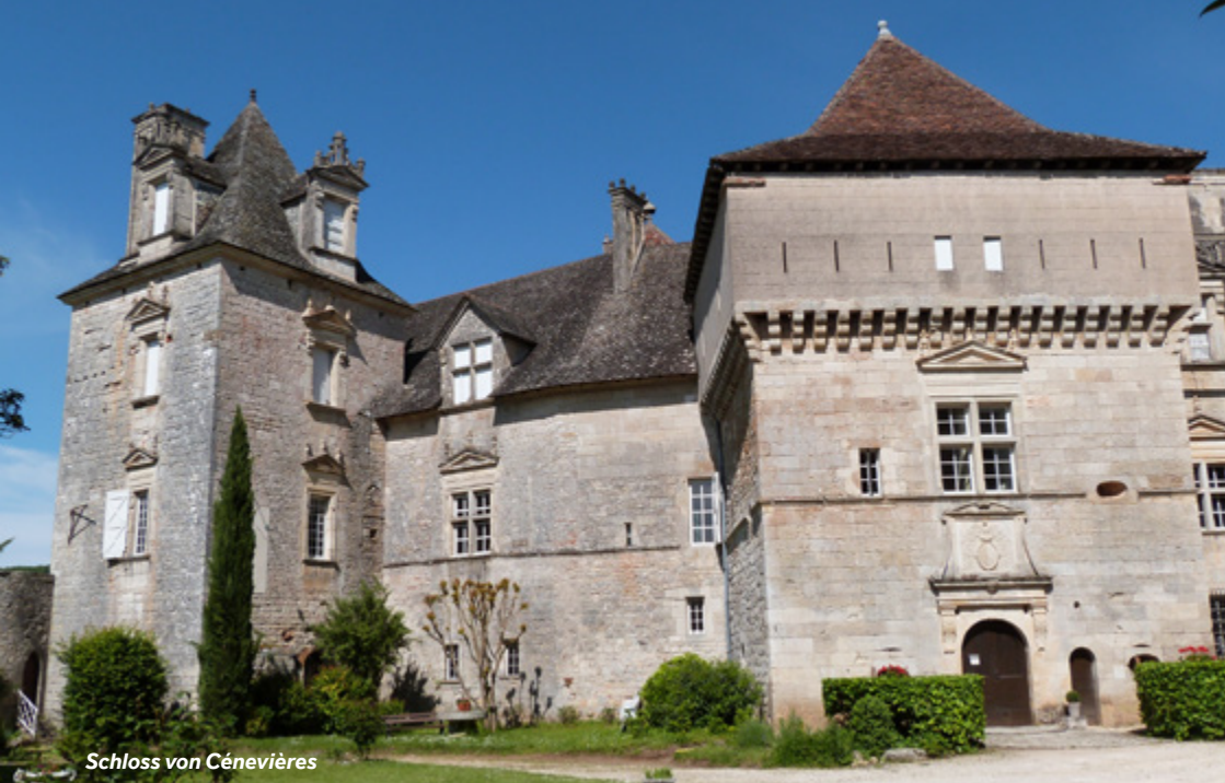
Schloss von Cénevières