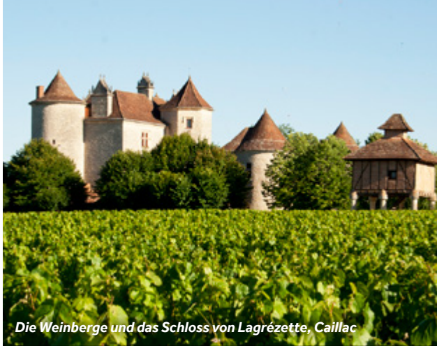
Die Weinberge und das Schloss von Lagrèzette, Caillac