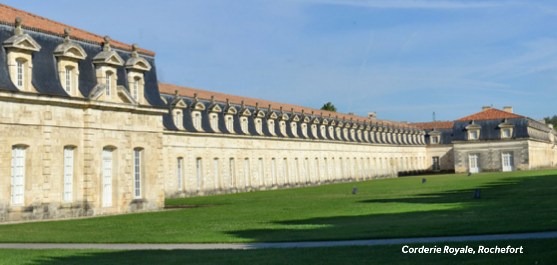
Corderie Royale, Rochefort