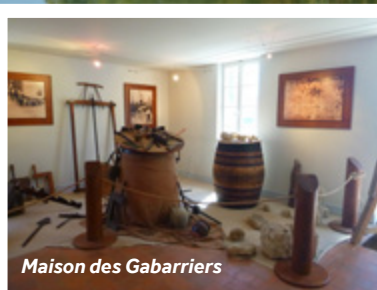
Maison des Gabarriers