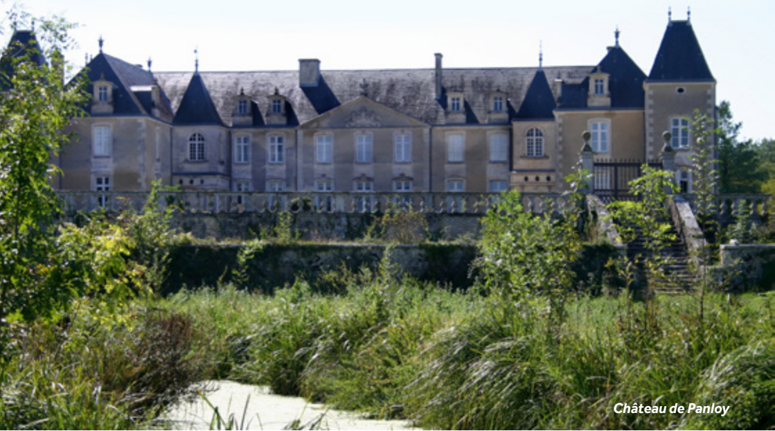
Château de Panloy