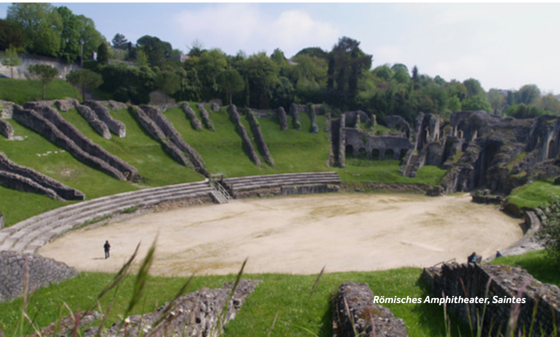
Römisches Amphitheater, Saintes

Wochenmarkt: Dienstag bis Sonntag (vormittags)