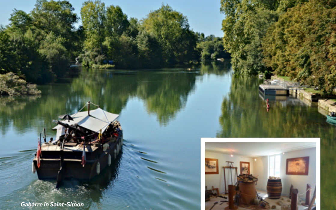
Gabarre in Saint-Simon