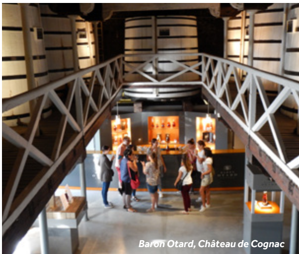
Baron Otard, Château de Cognac

Cognac ist international für seine Cognac-Produktion bekannt. Die Fassaden und Dächer sind mit einem leichten schwarzen Pilz bedeckt, der sich aufgrund der Verdunstung von Alkohol in der Luft bildet. Dies wird auch poetisch als ‚Produktions-Anteil der Engel‘ bezeichnet. In der Nähe des Yachthafens gibt es mehrere große Cognac-Handelshäuser, die Sie besichtigen können. Dort haben Sie auch die Möglichkeit, an Verkostungen teilzunehmen. Wir empfehlen einen Besuch und eine Besichtigungstour der Destillerie Baron Otard, die sich im Château de Cognac befindet, wo François I. geboren wurde. In Cognac können Sie zudem die Häuser von Salzhändlern, das großartige renovierte Kloster Récollets und eine Kirche aus dem 12. Jahrhundert mit romanischer Fassade entdecken. Besuchen Sie die großartige Touristeninformation und lernen Sie eine Vielzahl von Möglichkeiten kennen, die Stadt zu erkunden. Hier können Sie sich eine Broschüre mit dem Namen ‚Laissez-vous conter Cognac‘ (Entdecken Sie die Welt des Cognac) mitnehmen. Diese enthält ein Programm mit sechs empfehlenswerten Attraktionen.