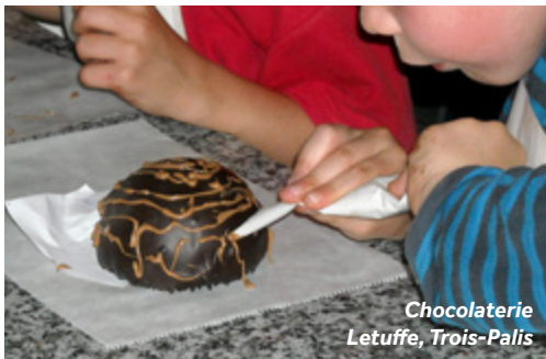
Chocolaterie Letuffe, Trois-Palis

Einrichtungen vor Ort: Hier finden Sie eher weniger Geschäfte und Restaurants, dafür aber großartige Schokolade!