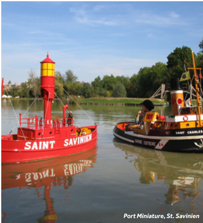
Port Miniature, St. Savinien