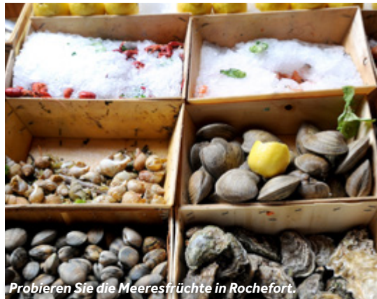
Probieren Sie die Meeresfrüchte in Rochefort.

Wochenmarkt: Dienstag, Donnerstag und Samstag (vormittags) – Avenue Charles de Gaulle und Les Halles