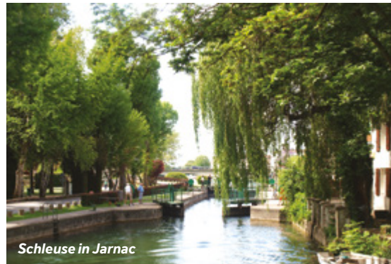
Schleuse in Jarnac

Wochenmarkt: Dienstag bis Sonntag (vormittags) – Rue Banvin