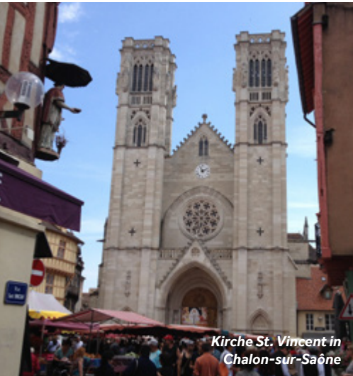
Kirche St. Vincent in Chalons-sur-Saône