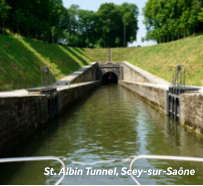
St. Albin Tunnel, Scey-sur-Saône