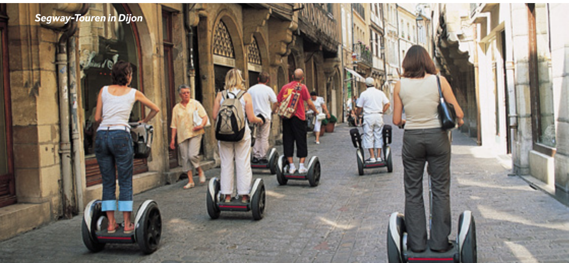
Segway-Touren in Dijon

Liegeplätze: Der Hafen verfügt über Wasser- und Stromanschlüsse, Toiletten, Duschen, einen Waschsalon und WLAN.