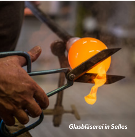
Glasbläserei in Selles

Liegeplätze: Le Boat hat hier eine eigene Basis mit WLAN, Wasser- und Stromanschlüssen sowie Duschen/Toiletten während der Öffnungszeiten.