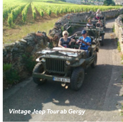
Vintage Jeep Tour ab Gergy

Restaurantempfehlung: La Halte Havana, mit Blick auf den Fluss Einrichtungen vor Ort: ein kleiner Supermarkt, eine Bäckerei, ein Metzger und ein Café