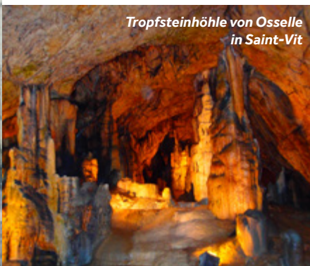
Tropfsteinhöhle von Osselle in Saint-Vit