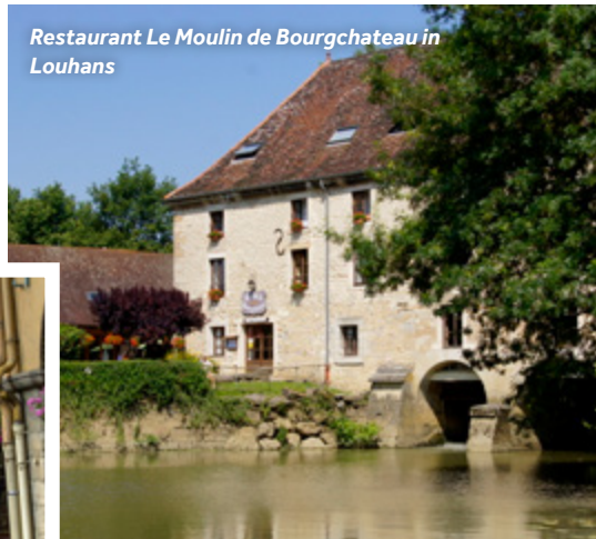
Restaurant Le Moulin de Bourchateau in Louhans

Einrichtungen vor Ort: Supermarkt, Bäckerei, Metzger, Cafés und Restaurants sowie WLAN.