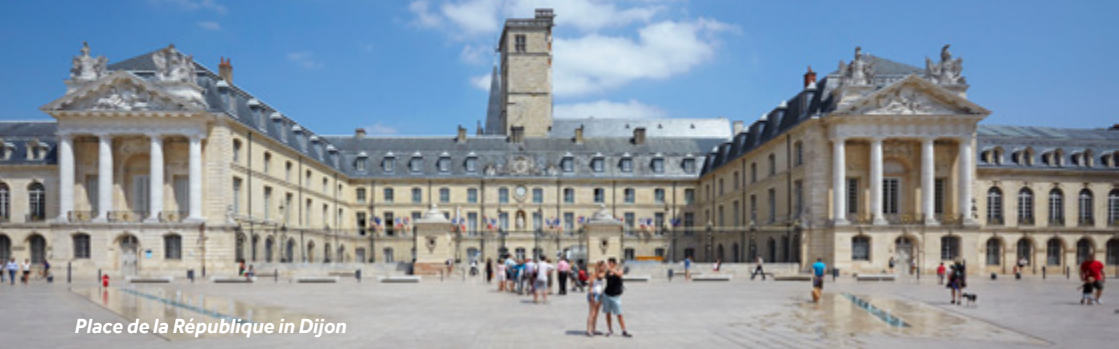
Place de la République in Dijon