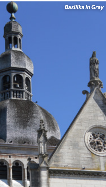
Basilika in Gray