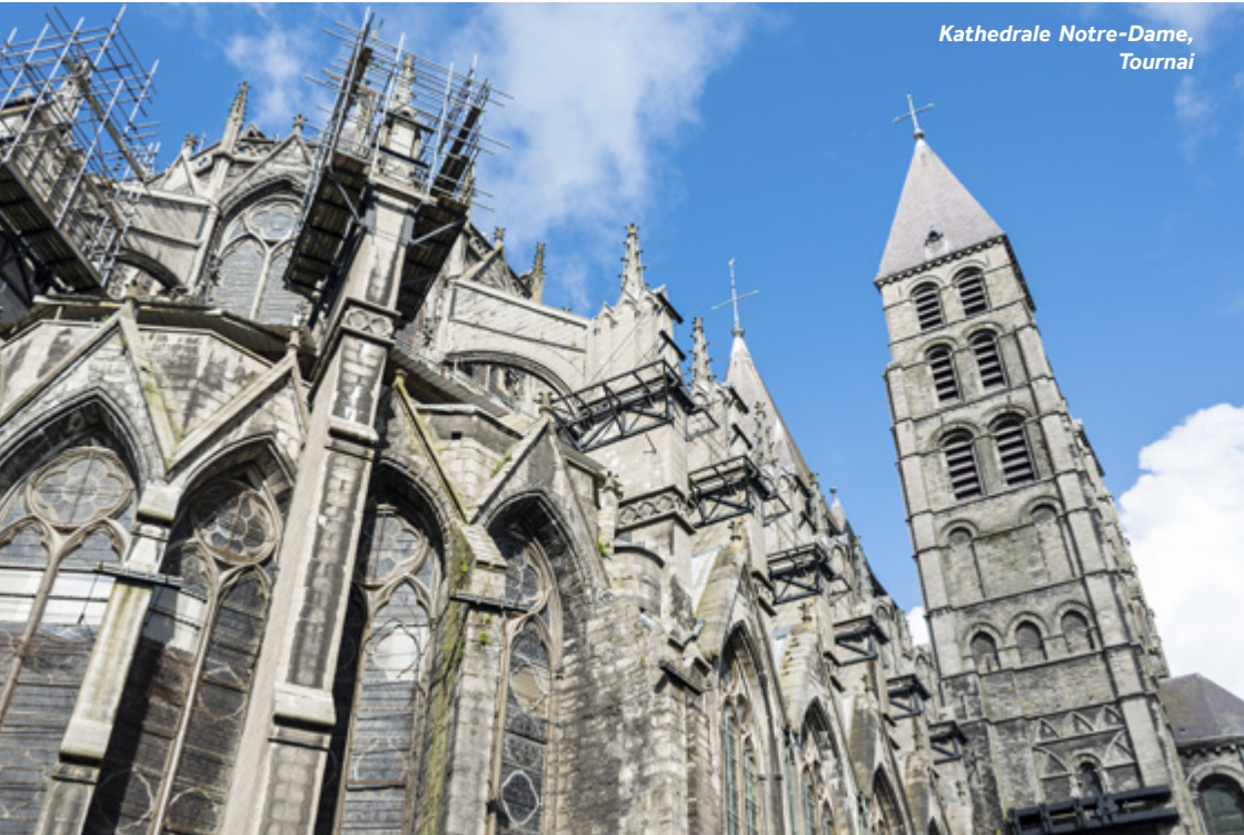
Kathedrale Notre-Dame, Tournai

Einrichtungen vor Ort: Viele Geschäfte und Restaurants sowie ein Supermarkt befinden sich in Gehweite südöstlich der Kathedrale.