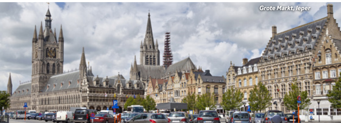
Grote Markt, Ieper