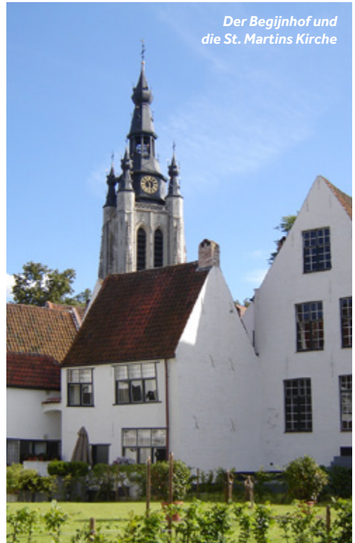
Der Begijnhof und die St. Martins Kirche

Einrichtungen vor Ort: Im großen Einkaufszentrum "K in Kortrijk" befinden sich Supermärkte und eine große Auswahl an Geschäften.