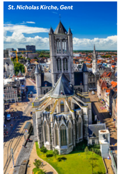
St. Nicholas Kirche, Gent

Restaurantempfehlung: Du Progress, in der Altstadt am Korenmarkt Einrichtungen vor Ort: Alle Geschäfte, Restaurants und Supermärkte, die Sie in einer großen Stadt erwarten.