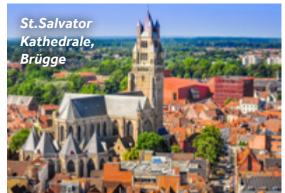
St. Salvator Kathedrale, Brügge

Restaurantempfehlung: Reliva, im Süden der St. Salvatorkathedrale auf der Goezeputstraat