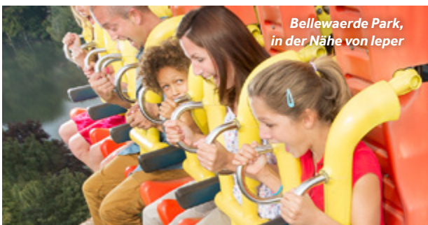
Bellewaerde Park, in der Nähe von Ieper