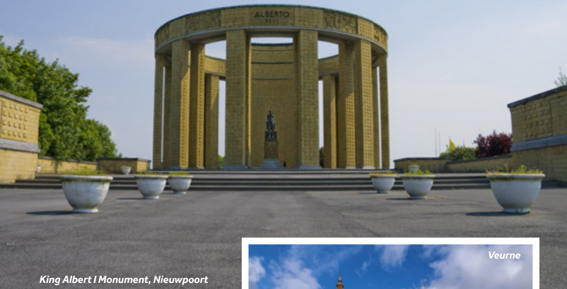
King Albert I Monument, Nieuwpoort