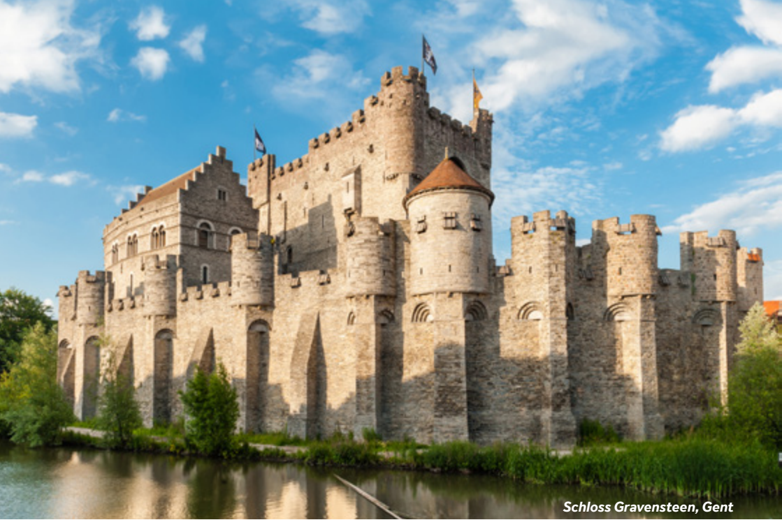
Schloss Gravensteen, Gent