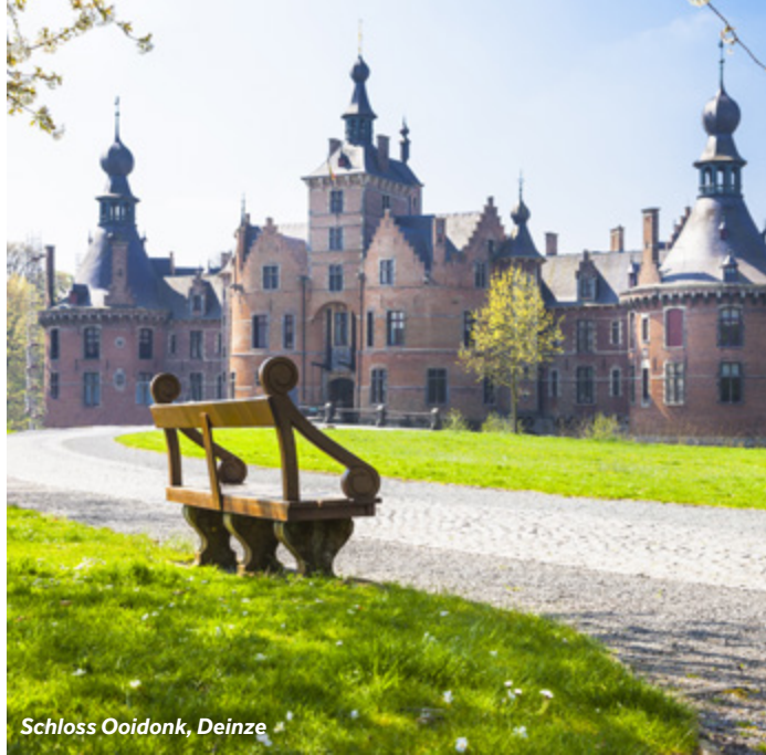
Schloss Ooidonk, Deinze

6 km nordöstlich gelegen befindet sich das elegante und majestätische Schloss Ooidonk, eines der schönsten in Europa. Das Schloss selbst ist nur an Sonn- und Feiertagen geöffnet, die Gärten sind jedoch von Dienstag Nachmittag bis Sonntag geöffnet und laden zu einem entspannenden Spaziergang ein.